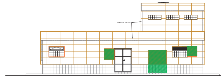
ALZADO LATERAL IZQUIERDO